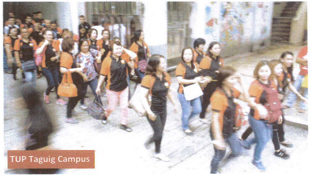
TUP Taguig Campus