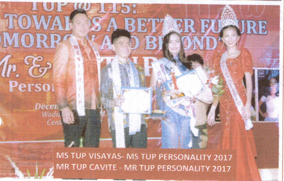
MS TUP VISAYAS- MS TUP PERSONALITY 2017 MR TUP CAVITE - MR TUP PERSONALITY 2017