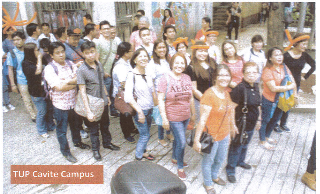
TUP Cavite Campus