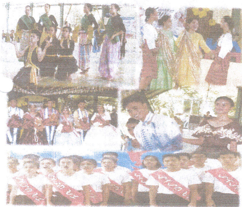
Mga mag-aarawan: iba't ibang presentasyon na itinanghal ng mga estudyante at mga kalahok at nagwagi sa Lakan at Lakambini noong selebrasyon ng araw ng wika ika-28 ng Agosto 2019 sa TUPC-Cavite Covered court.